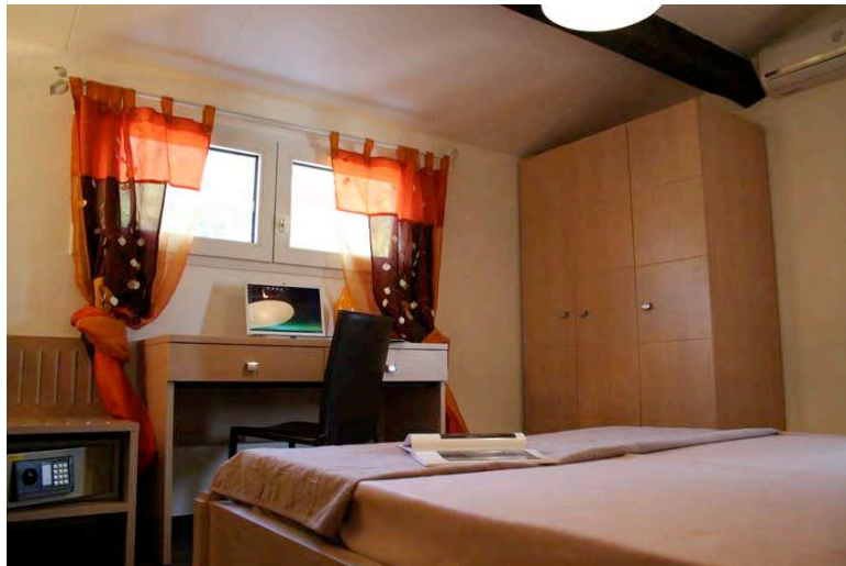
Chambre en duplex